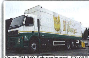
Volvo FM 340 Schwenkwand, EZ: 08/04 299 TKM, Liftachse, Orten Topliner-Überdach 9.400 mm lang, 22 Paletten, 4 rhg. rückw. Ladegutsicherung, BÄR Ladebordwand, VEB-Bremse, Automatik, gepfl. Zustand, INTERNE-Nr.: 9733