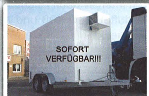
Isopolar Tandem Kühlanhänger NEU, V-Deichsel mit PKW-Kupplung, 2,7 to Gesamtgewicht, Innenmaße 3.470 x 1.670 x 2.000 mm, Nutzlast: 6.000 kg, Portalhecktüren, INTERNE-Nr.: 9612