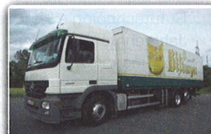
Mercedes Benz ACTROS 2541 Getränkefahrzeug, EZ: 11/03, 432 TKM, Euro 3, Fernverkehrsfls, 8.200 mm Aufbau Böse, 2 to BÄR LBW, VDI 2700ff. 4 rhg. LGS, AHK, INTERNE-Nr.: 9673