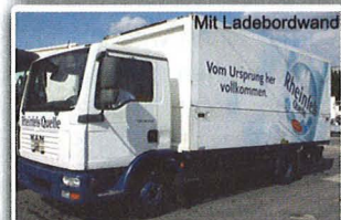
MAN TGL 12.210 Getränkeverteiler, EZ: 01/06, Euro 4, 226 TKM, Ewers-Überdach Schwenkwand, 5.250 mm Aufbau, 4 rhg. LGS, LBW MBB 2.000 kg, VDI 2700, 2 x AHK, INTERNE-Nr.: 9738