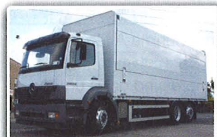
Mercedes Benz 2528 Getränkeverteiler, EZ: 05/04, 160 TKM, Euro 3, AHK, Nahverkehrsfls, Überdach-Aufbau mit Ladebordwand, Innenl. 7.250 mm (18 Europ) Ladegutsicherung, INTERNE-Nr.: 9688

Informationen zur Veranstaltung unter www.vlb-berlin.org/okt2011 .