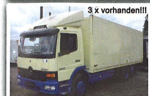
Mercedes Benz 1528 Getränkeverteiler, EZ: 09/02, 142-272TKM, 280 PS, Euro 3, Überdach-Aufbau, Ladebordwand, Anhängerkupplung, Ladegutsicherung, NL 10.900 kg, INTERNE-Nr.: 9665