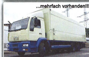
MAN 20.280 Getränkeverteiler, EZ: 11/02, 122 - 260 TKM, 280 PS, Euro 3, Überdach-Aufbau, Orten/Ewers-Aufbau, 7.300 mm Aufbau, LBW, 4-rhg. LGS, AHK Nachlaufkchse, INTERNE-Nr.: 9762