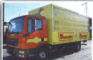
MAN TGL 12.210 Getränkeverteiler, EZ: 01/07, erst 57TKM! EURO 4, Aufbau innen ca.: 5.200 mm, AHK, 6 Gang Schaltgetriebe, VDI 2700 mit 4 reihiger LGS, INTERNE-Nr.: 9657