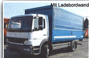
Mercedes Benz 1218 Getränkeverteiler, EZ: 07/07, 168TKM, Bordwand mit Rollplane, Euro 4, 5.100 mm Aufbau, Nahverkehr, Schaltget., geschl. Bordwand, PKW-AHK, INTERNE-Nr.: 9573